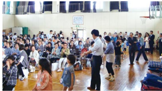
敬老の皆様を囲んで踊った「お米ありがとう音頭」