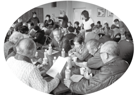
“おーいお茶”を囲んでの茶話会

今年2月18日に八生公民館で行われた茶話会には地区の高齢者の方が60名近く集まりました。今年行ってみたいところなど、たくさん意見が出ました。 「バス旅行は楽しいのでまた実施してほしい。足が不自由な人もいるので近くで余裕のあるところへ行きたい。」 「行ってみたいところはドイツ村、太陽の里、マザー牧場、高尾山、筑波山、スカイツリー、屋形船鎌倉・江ノ島、鹿島・大洗、イチゴ狩り、見る、食べる、買う、なんでも楽しみたい」 「グラントゴルフは初心者でもやってみると楽しいので続けてほしい。室内に残っている人は室内ゲームをやってみよう」 「子どもと一緒に遊んだり話し合ったりするのは楽しいので、続けてほしい。給食もよかった。」 “おーいお茶”を囲んでの茶話会