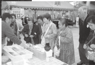
道の駅いたこで休憩と買い物

会って、話して、食事して。こういった出会いが災害時など、困ったときの助け合いにつながりますね。