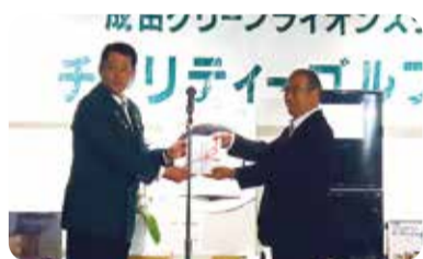
成田グリーンライオンズクラブ様