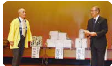
食彩の里カラオケ愛好会様