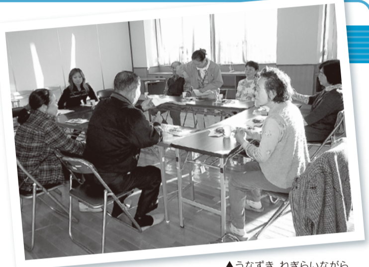
▲うなずき、ねぎらいながら、おたがいの経験を語り合います。下総地域福祉センター(猿山)での様子

「介護していることを隠さないで、近所にオープンにした方がいい。近所の方が本人や家族に声をかけてくれる」