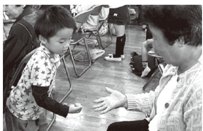
▲久しぶりにジャンケンです。勝ちましたね！