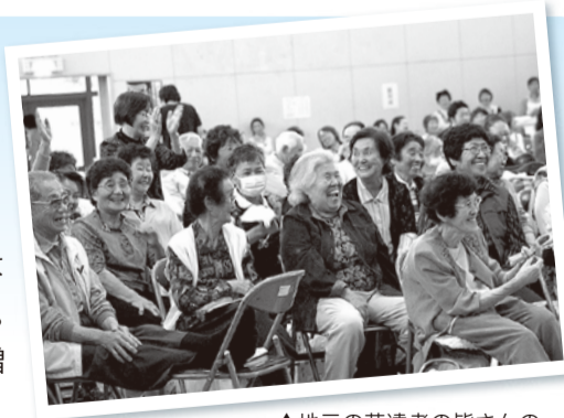
▲地元の芸達者の皆さんの演技に、会場は笑いの渦につつまれました。