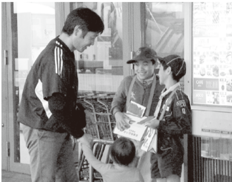
▲募金して下さる方も、募金の呼びかけにご協力くださる方も皆様、すべてがボランティアです。

昨年10月から12月にかけて実施しました「赤い羽根共同募金」「歳末たすけあい運動」におきましては、区・自治会・町内会をはじめ、街頭募金、職域募金、学校募金、法人募金など、大変多くの皆様からあたたかいご支援を賜りました。お寄せいただいた募金は成田市の地域福祉推進に活用させていただきます。ご協力くださいました皆様に心より感謝申し上げます。