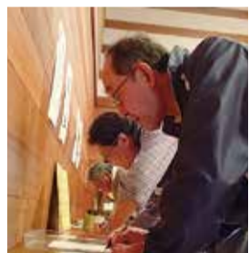
ボランティアの受け入れは、まず受付からはじめます

①受付 → ②オリエンテーション → ③マッチング → ④資材貸出・送り出し → ⑤報告・報告書記入