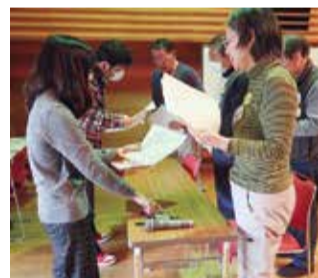
現場に必要な資材を貸出し、ボランティアを送り出します