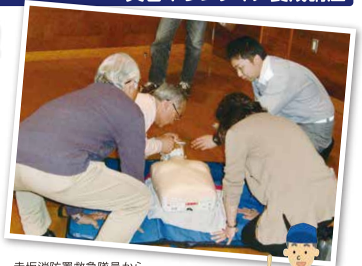
赤坂消防署救急隊員から心肺蘇生法を教えてくださいました

午後からは根木名川が氾濫したという想定で災害ボランティアセンター立上げ訓練を行い、ボランティア役と災害ボランティアセンターを運営するスタッフ役で実際の活動までの流れを体験しました。