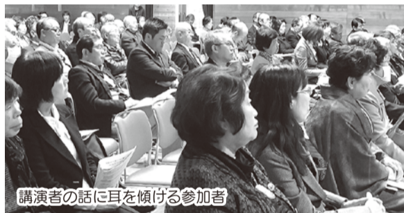
講演者の話に耳を傾ける参加者