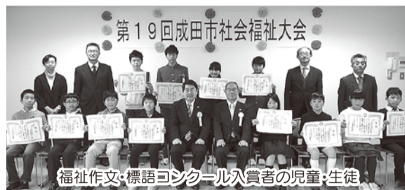
福祉作文・標語コンクール入賞者の児童・生徒

第2部では、「大震災で九死に一生を得て」と題し、東日本大震災についての講演会を行いました。スクリーンには、ボランティア団体の皆さんが熱心に活動されている様子や少しずつ変わりゆく復興状況などが写し出され、貴重な体験談を聴くことができました。津波で家族を失い、ふるさとを奪われた心の傷は消すことができない人は多いはず。すべてを失ったという講師からは、人の温かさや助け合いの心、再度立ち上がろうとする人の心の強さなどが伝わってきました。今年で5年目を迎えた震災ですが、1日も早い復興を願うばかりです。