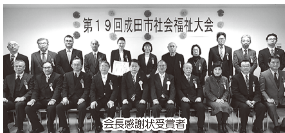
会長感謝状受賞者