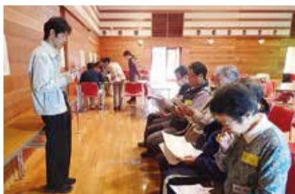
ボランティアの心得えについて説明を受けました