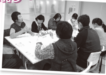
一人ひとりが 意見を出し合いつながりを深めました

次に、「地域で支える認知症」を事例を通して学びました。それぞれの立場から考えられる支え合いのアイデアを出し合い、自らの実践から、あるいは実生活から、さらには希望も交え話し合いをし、最後は各グループごとに発表をしました。今後もそれぞれの参加者との交流を積み重ねていくことで、地域のつながりやしくみをつくっていくことが大切であると感じました。