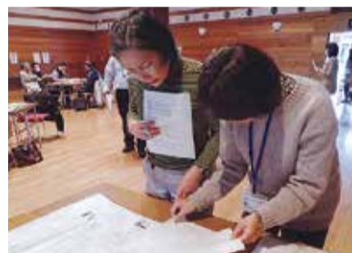
自分が希望するボランティアが決まったら、地図を見て現場を確認します