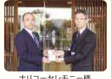
ナリコーセレモニー様