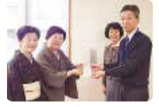
茶道裏千家淡交会千葉県支部 職域地域茶道連絡協議会様