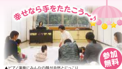
▲ピアノ演奏にみんなの顔が自然とにっこり