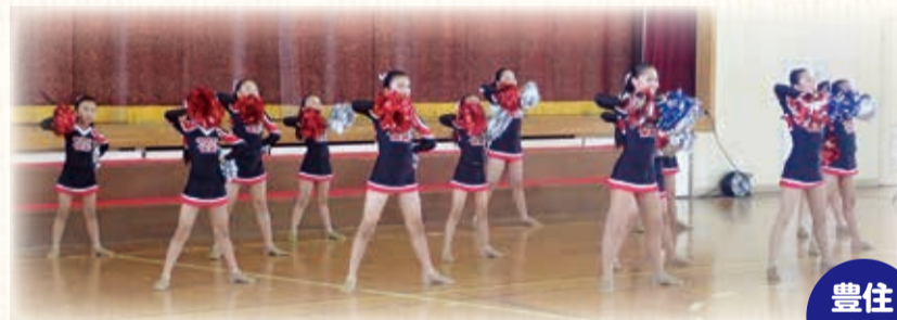
小・中学生のチアダンス