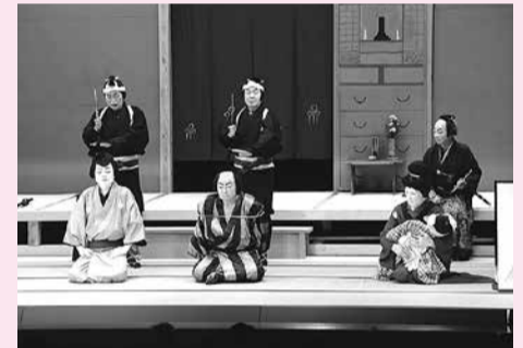
演目:奥州安達原二段目 文治住家の場より

毎年4月に行う3日間の大須賀大神例大祭は、子どもから大人までがそれはそれは楽しみにしていたもので、親戚の人も呼び合うほどの昭和30年ごろまでは町いちばんの賑やかな行事でした。例大祭は「伊能のおあそび」とも呼ばれ、大衆でもっとも人出が多く近隣の学校もこの期間は休みとなったほどでした。この祭礼は伊能1区から4区までが年番で当番となり、祭り行列や神楽の奉納、歌舞伎、ヤブサメなどが行われていました。