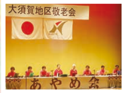
大正琴の演奏を披露する あやめ会の皆さん