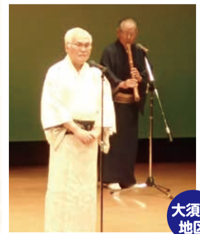
郷愁あふれる「南部牛追唄」