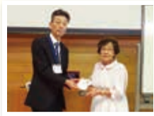
成田市フォークダンス協会