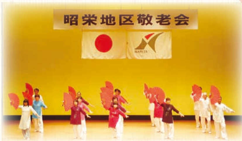
扇で華やかに! 太極拳成田大栄会の皆さん