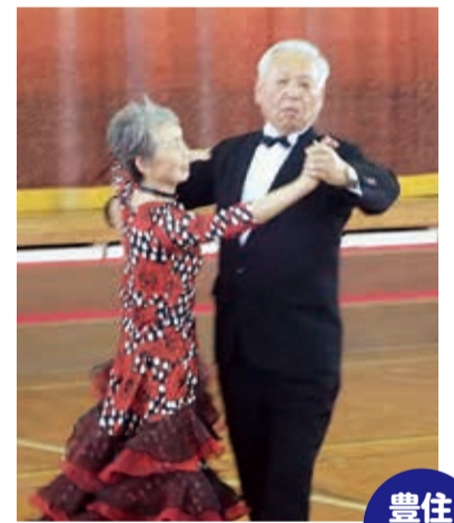
ご夫婦によるダンス!