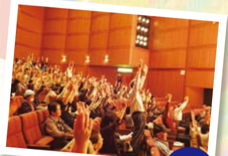
みんな 元気いっぱい健康体操!