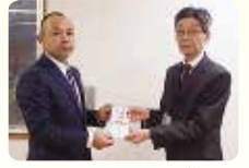
ナリコーセレモニー様