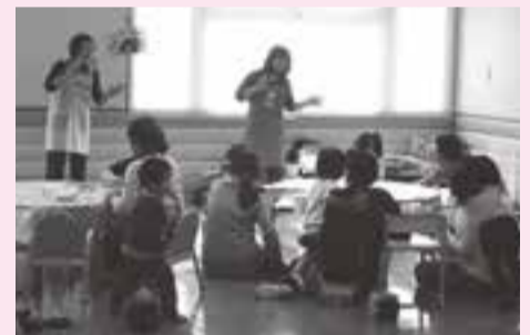
保健福祉館ちびっこ広場での活動の様子

長く活動する中で子育て支援には、子育て中のお父さんやお母さんと一緒に活動することが必要と考え、今までの人形劇での経験を活かし、平成12年にボランティアグループいとぐるまとして新たに活動をはじめました。いとぐるまとは、「楽しい夢をつむいでいくいとぐるま」という意味が込められています。「この活動をもっと地域に広げたい」と思っていたところに、「保健福祉館のちびっこ広場で活動してみませんか」と声をかけていただき、オープン当初からずっと活動しています。