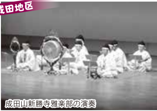
成田山新勝寺雅楽部の演奏