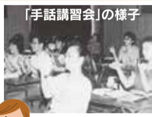
「手話講習会」の様子