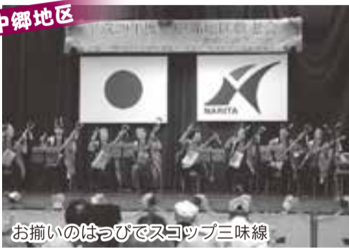
お揃いのはっぴでスコップ三味線