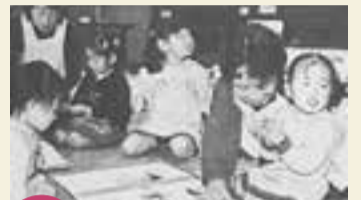
平成14年 子育てサポート隊発足