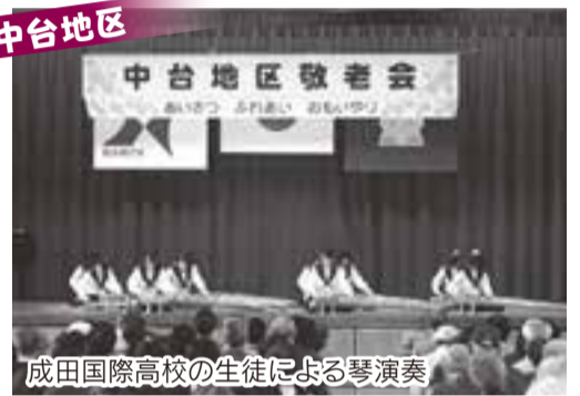
成田国際高校の生徒による琴演奏