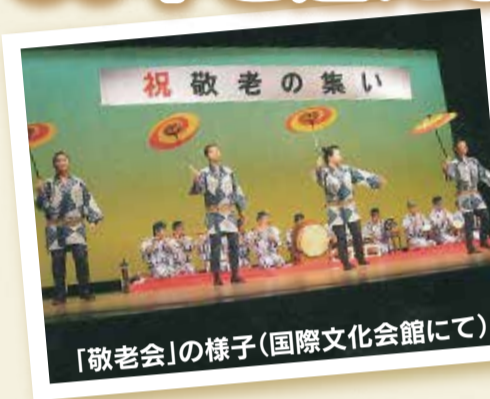
「敬老会」の様子(国際文化会館にて)