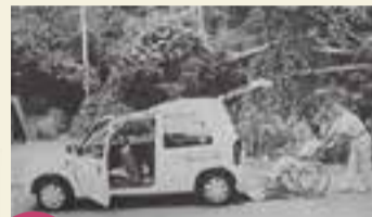
平成9年 移送サービス事業開始