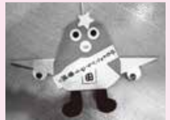
折り紙で作ったうなりくん

今後もいとぐるまのような活動が地域にも広がり、みんなで子育ての手助けができるようになっていくとうれしく思います。