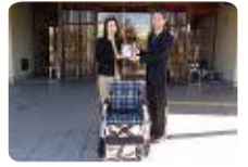
(株)日立物流 バンテックフォワーディング様