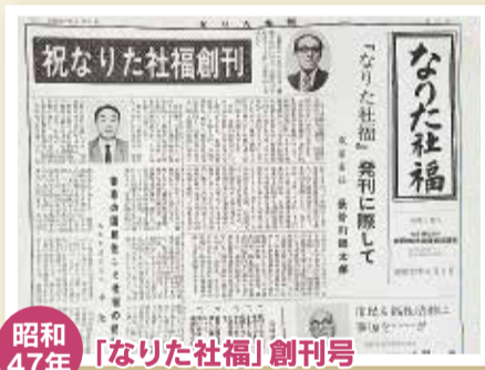
昭和47年 「なりた社福」創刊号