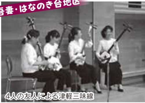
4人の友人による津軽三味線