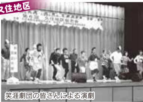
笑涯劇団の皆さんによる演劇