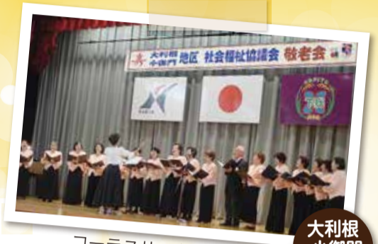
コーラスサークルわらべの美しい歌声