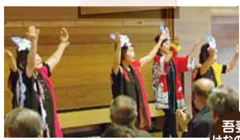
吾妻豊令会の皆さんの陽気な踊り