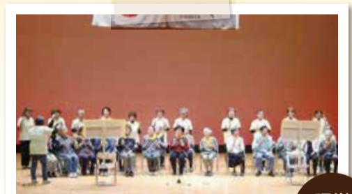
あおぞら会の心を合わせたハンドベルの演奏