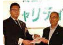
成田グリーン ライオンズクラブ様