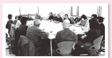
アドバイザーを交えた交流会