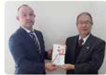
ナリコーセレモニーチャリティー カルチャースクール参加者一同様