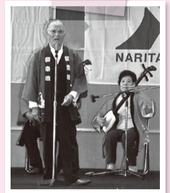
敬老会で民謡を披露

また、誰かが困っていれば、大層なことはいませんが、自分にできることを手助けしたいと思っています。皆がお互いに手を携えて、助け合っていく優しい社会になればいいなと常々思っております。