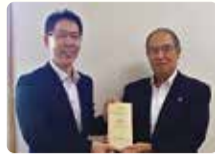
イトヨーカドー 労働組合成田支部様