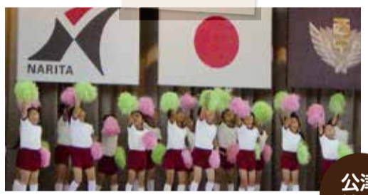
元気いっぱい！ 公津の杜保育園児のお遊戯