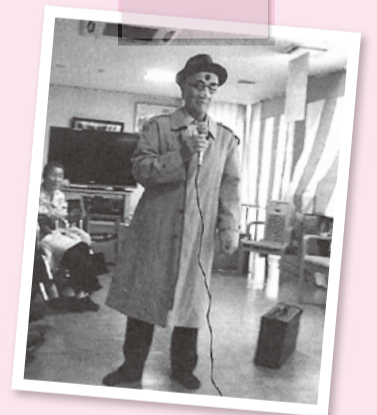
へしらかば～ 衣裳もつけて、みんなで大合唱