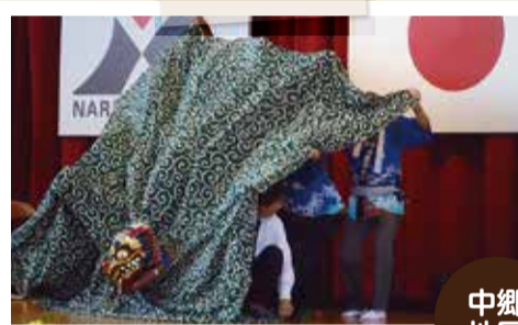
芦田伝統芸能保存会の豪快な獅子舞