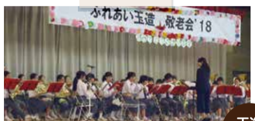
玉造中吹奏楽部の一生懸命な演奏