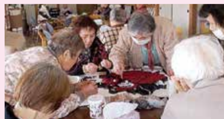
年賀状作り (生活クラブ風の村デイサービスセンターなりた)