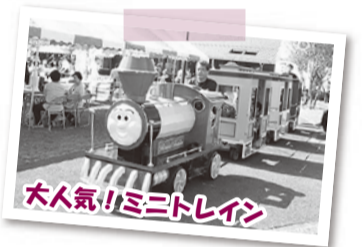
大人気!!ミニトレイン

◇ジュース・パン、綿菓子、焼きそば、フランクフルトや野菜など食料品の販売・施設で作った工芸品、作品等の販売・お子様が楽しめるゲーム・展示など