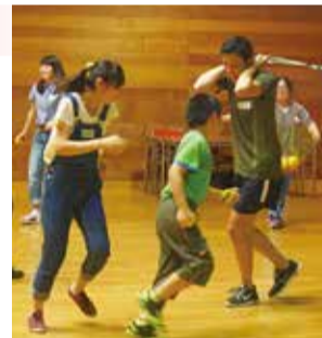
夏休み子どもふれあいサロン