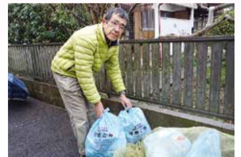
成田おたすけ隊の活動