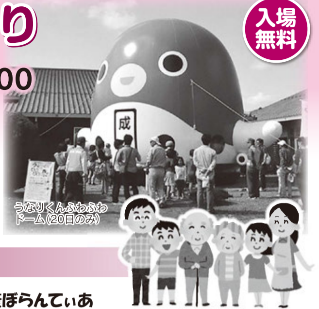
うなりくんふわふわドーム(20日のみ)

《安心して暮らせる健康と福祉のまち》をテーマに、健康づくりと充実した福祉を目指して、成田市保健福祉館で「成田市健康・福祉まつり」が開催されます。健康づくりや福祉などについて、小さなお子様からご高齢の方まで幅広い年代の方が楽しめる、さまざまな体験や学習ができる2日間です。ご家族やお友達をお誘い併せてお越しください。