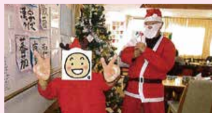
サンタさんと一緒にクリスマス会 (ゆったり文化村成田デイサービスセンター)