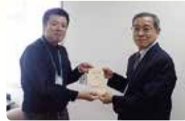
イトーヨーカドー労働組合 成田支部様