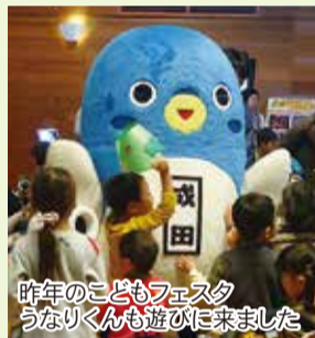
昨年のこどもフェスタ うなりくんも遊びに来ました