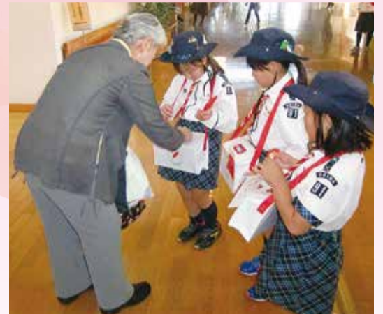
健康・福祉まつりでの募金活動