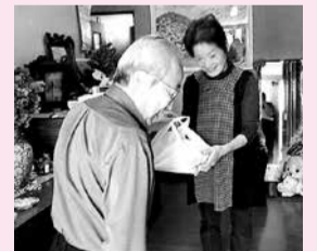
民生委員さんが届けています。

地区の方々が調理ボランティアとして代替わりをしながらも、連綿と続いている様子は、自分の住む地域に対する地元愛と住民同士の結びつきの絆の強さを感じられました。