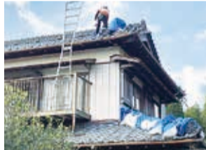
崩れてしまった屋根の棟、屋根の穴などはブルーシートで覆い、土嚢で抑えました。