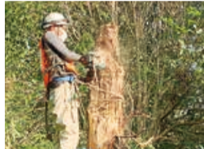
倒れたり、倒れかけている木の幹や枝を、運搬できる大きさまでチェーンソーで切断し、被害の拡大を防ぎました。