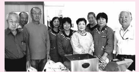
民生委員さんと調理ボランティアのみなさん

社会福祉協議会では、市内16の地区社会福祉協議会を通じて、「独居高齢者ふれあい訪問等サービス事業」を行っており、地域にお住まいの65歳以上のひとり暮らしの高齢者を対象に、毎月1回、配食や食事会を実施し、地域社会とのつながりを深めることを目的としています。