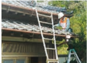
雨漏りの原因となる屋根瓦のずれなどを修正しました。