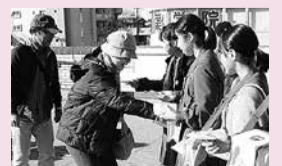
歳末たすけあい街頭募金に協力