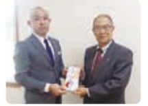
ナリコーセレモニチャリティーカルチャースクール参加者一同様