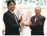
成田グリーンライオンズクラブ様