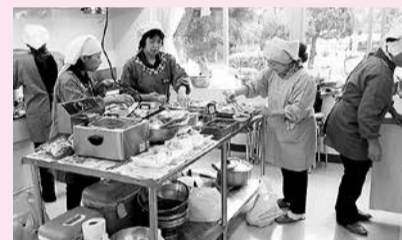
和気あいあいとした調理の様相

調理するボランティアは11名が2班にわかれ、月ごとに交代しながら調理しています。調理は昨年4月にオープンした中郷ふるさと交流館の調理室に集まって行います。