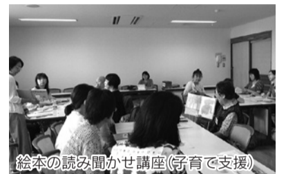
絵本の読み聞かせ講座(子育て支援)