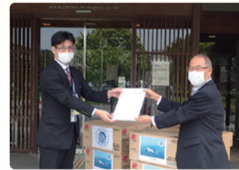
ユナイテッド航空会社様