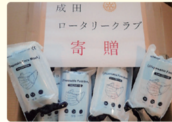
成田ロータリークラブ様