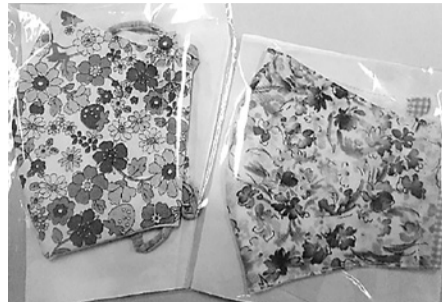
花柄の布で作られた手作りマスク