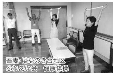
吾妻・はなのき台地区 ふれあい会 健康体操