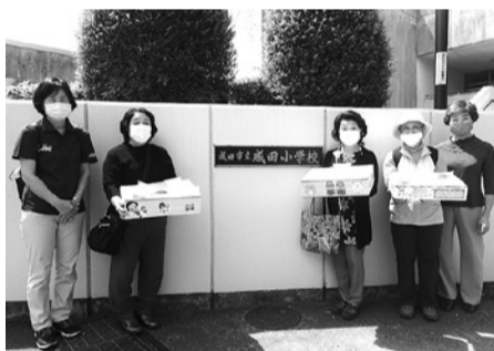
成田児童ホーム(5月15日)、美郷台児童ホーム(5月19日)での手作りマスクの受け渡しの様子