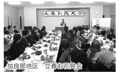
加良部地区 立春お花見会