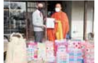
ワットパクナム日本別院様