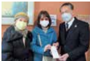
フルーツバスケット様