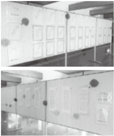
保健福祉館にて、福祉作品コンクールの入賞作品を展示しました。(令和4年2月1日(火)~2月14日(月))