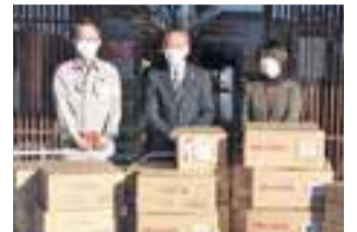
東京ガス株式会社 CS推進グループ 千葉お客さまサービスチーム様