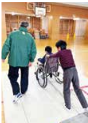
学校での福祉体験学習