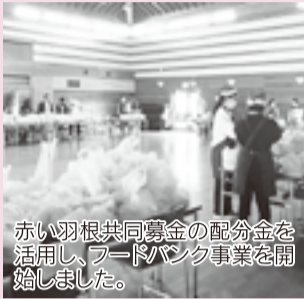
赤い羽根共同募金の配分金を活用し、フードバンク事業を開始しました。

赤い羽根共同募金 約70%が成田市の地域福祉活動に還元されます。具体的には、令和4年度に本会が実施する事業（ボランティア活動や子ども会行事への助成、生活困窮者支援事業など）のために使われる予定です。