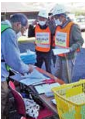
災害ボランティアセンター立ち上げ・運営訓練