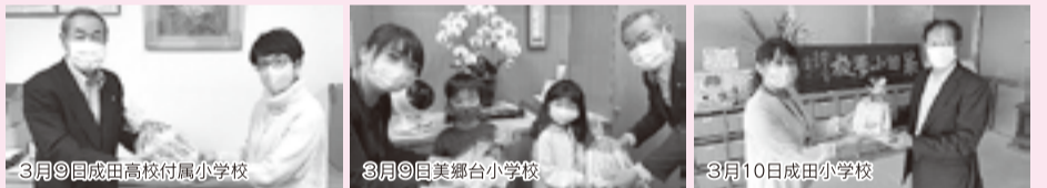
3月9日成田高校付属小学校