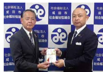
ナリコーセレモニーチャリティーカルチャースクール参加者一同様(右)