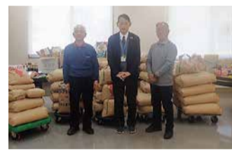
大利根地区社協 高岡支部様(左、右)