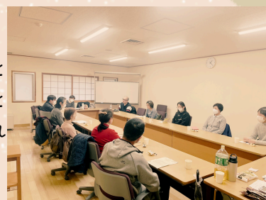
実際の家族交流会の様子

日時：偶数月の第4水曜日 13：00～15：30 会場：保健福祉館（成田市赤坂1-3-1）