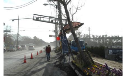
災害はいつ起こるかわかりません

いつ起こるか分からない自然災害。野田市を襲った竜巻も記憶に新しいところです。東日本大震災の際も、成田市内でも負傷者や住宅損壊など、多くの被害がでました。大規模災害が起こった時、地域の復興には行政だけではなく、市民の皆さんの協力が不可欠です。ボランティアセンターでは、いざという時地域で活動していただける災害ボランティアの養成講座を開催します。ボランティア活動の知識だけではなく、被災した時の応急手当なども学んでいただきます。ぜひ、ご参加下さい。